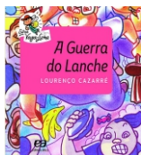
A Guerra do Lanche Editora Ática