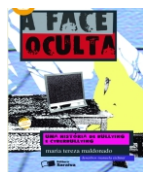
A face Oculta Editora Saraiva