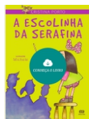
A Escolinha da Serafina Editora Ática