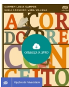
A cor do preconceito Editora Ática