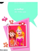
A mulher do meu pai Editora Scipione