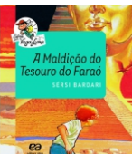
A maldição do tesouro do faraó Editora Ática