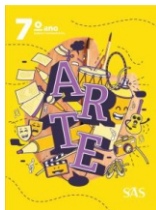
Arte Livro único