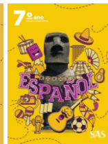
Espanol Livro único