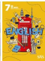
English Livro único