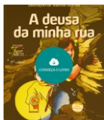
A deusa da minha rua Editora Saraiva