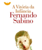
A Vitória da infância Editora Ática