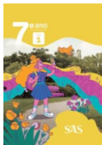
7º ano 4 livros integrados