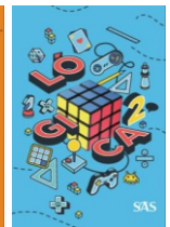
Lógica Livro único