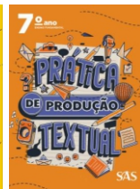
Práticas de Produção Textual