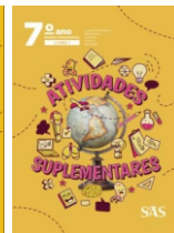
Atividades Suplementares 4 livros integrados