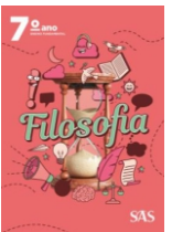
Filosofia Livro único