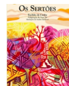
Os sertões Editora Ática